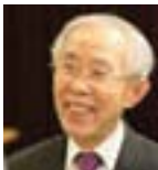
손봉호 본지 대표주간, (사)기독교세계관학술동역회 이사장. 서울대에서 영문학을 전공하고 암스테르담자유대학교대학원에서 철학 박사학위를 받았으며 한국외대, 서울대 교수를 거쳐 동덕여대 총장과 세종문화회관 이사장을 역임하였다. 서울대 명예교수, 고신대 석좌교수이며 나눔국민운동본부 대표로 섬기고 있다.

자급자족이 많이 이뤄졌을 때나 가족 혹은 잘 아는 사람이 쓸 물품을 생산할 때는 속이는 경우가 별로 없었고, 따라서 상도덕이 문제가 되지 않았다. 물론 오늘날에도 생산자들이 정직하고 정의롭게 상품을 제조하고 유통시킨다면 그보다 더 바랄 것이 없고 실제로 그런 생산