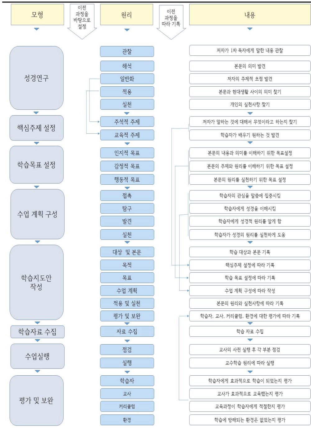
[그림-3] 교회학교의 효과적인 성경교육을 위한 교수모형