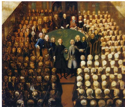
그림-7 하이트(Johann Valentin Haidt)의 그림: 헤른후트 총회

zinzendorf.com/pages/data/uploads/decree_lg.jpg