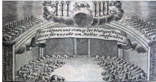
그림-2. 모라비안의 오순절 (1727년 8월 13일 수요일 저녁)

romans1015.com/wp-content/uploads/2022/01/Moravians-Praying.jpg