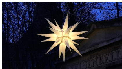
그림-6. 헤른후트 공동체가 만드는 베들레헴의 별

cdn.mdr.de/mdr-garten/gestalten/beleuchtung-licht-sterne-led-baeume-100_v-variantBig16x9_w-1280_zc-b903ef86.jpg?version=43336