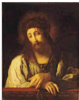
그림-1. 도메니코 페티(Domenico Fetti)의 에케호모(Ecce Homo, “이 사람을 보라”)

zinzendorf.com/pages/data/uploads/domenico.jpg