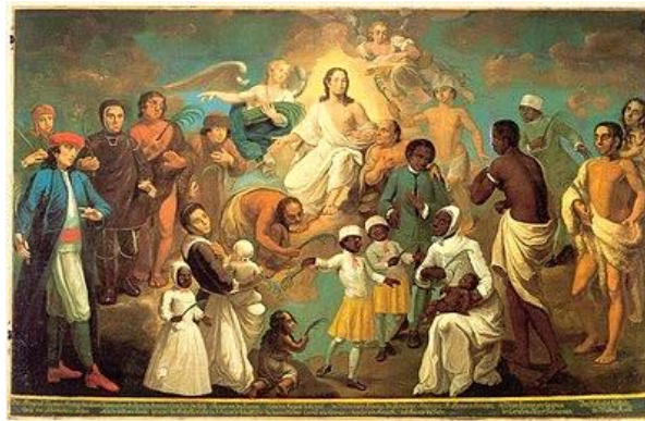
그림-8 하이트(Johann Valentin Haidt)의 그림: 첫 열매(Das Erstlingsbild)

upload.wikimedia.org/wikipedia/commons/thumb/c/c1/Johann_Valentin_Haidt_-_Erstlingsbild_%281747%29.jpg/1280px-Johann_Valentin_Haidt_-_Erstlingsbild_%281747%29.jpg