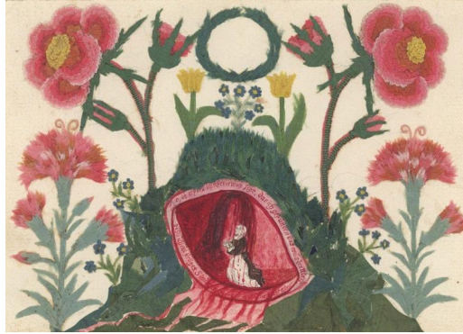
그림-4 그리스도의 옆구리 상처 안에서 기도하는 한 자매 (Marianne von Watteville의 작품)

artandtheology.org/wp-content/uploads/2020/10/living-in-the-side-hole.jpg